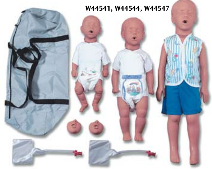
W44541, W44544, W44547